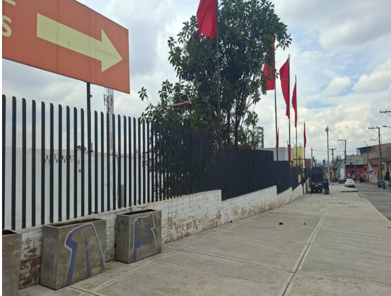
IMAGEN 3: FACHADA CALLE 1 SUR